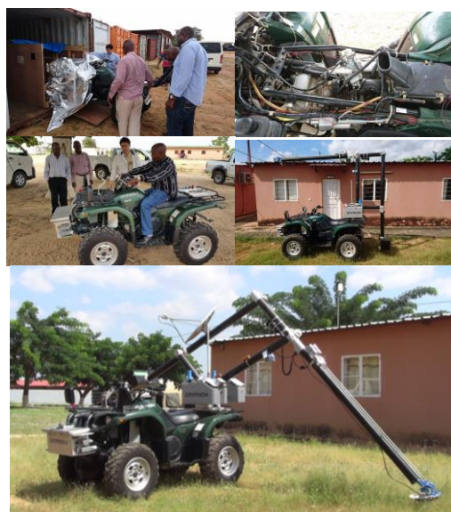
写真4 第3回海外学術調査旅行の様子

(3) 第3回海外学術調査旅行（平成28年3月12日～平成28年3月20日）（写真4）：日本から海上輸送した地雷探査バギー車は2015年（平成27年）3月末に無事INAD側で受け取りが完了し、施設内のコンテナに1年間保管されていた。バギー車のエンジンを長期間始動していなかったため、キャブレターの分解清掃とスパークプラグ調整等の大掛かりなメンテナンス作業が発生した。これらの作業はすべて屋外の木陰で行う必要があった。バギー車にロボットアームを搭載