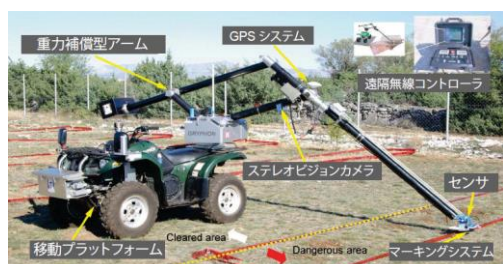
写真1 遠隔操作アーム搭載バギー車両

写真1に示すロボットシステムでは、遠隔操作可能なバギー車両に搭載した長いリーチのロボットマニピュレータ先端に装備された地雷センサの空間的位置・姿勢が正確に把握できる。このため、本研究では本ロボットシステムのマニピュレータの自動走査によ