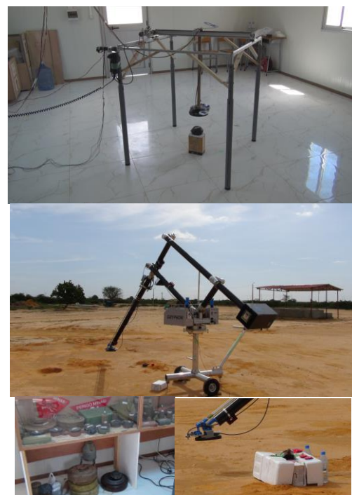
写真2 第1回海外学術調査旅行の様子

(1) 第1回海外学術調査旅行(平成26年3月10日~3月22日)(写真2): 初年度はロボットマニピュレータの改修作業を優先し、バギー車両本体は改修後2年度目に海上輸送するよう計画した。写真2に示すアルミフレームで構成したXYマニピュレータと地雷探査ロボットアームを現地に航空輸送し、現地で組立てて動作を確認した。特に屋内でXYマニピュレータを用いてデータ収集の予備実験を行った後、移動座台にロボットアームを搭載して屋外でも問題なくデータ収集を進められることを確認した。また関係者への実演も行い、現地作業者の意見を伺いながら、地雷原での運用のための安全措置等を考慮した標準実施要領 (SOP) について議論し、INAD との協力関係を深めた。初年度の調査チームには大学院生と学部生が計3名参加しそれぞれ有意義な調査作業を実施した。