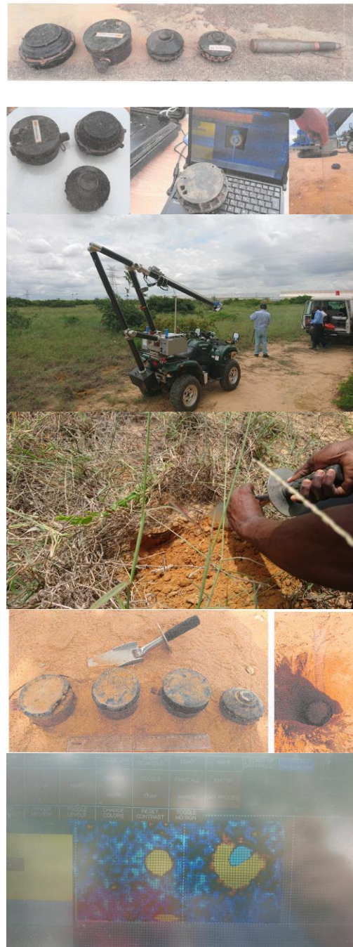
写真6 第5回海外学術調査旅行の様子

本研究では、ロボットマニピュレータ先端部に金属探知機を装備して自動走査させることによって高精度な空間位置・姿勢情報を含めた信号収集を可能とするシステムを用いて、地雷や金属片の埋設深さ、姿勢、種類や隣接状態を変えながらデータ収集し解析することで金属破片と実際の地雷との判別可