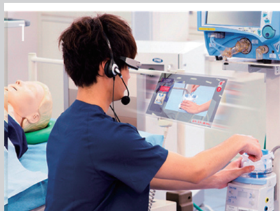
図1 視線を外さずハンズフリーでコンテンツを確認しながら医療手技・操作を行える

医療事故件数4600万人、医療ミスで死亡する人数240万人(年間)。飛行機で死亡するリスクは300万人に1人。医療事故が原因で患者が死亡するリスクは300人に1人と推定。WHO(世界保健機構)は、医療過誤が世界における疾病の発生率と死亡率に多大な影響を及ぼしていると報告。